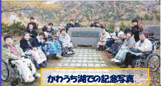
かわうち湖での記念写真

平成25年11月2日、利用者15名が参加し川内ダム方面へ紅葉狩りに行ってきました。久々の外出でしたが、残念ながら紅葉は散り始めていました。しかし、道の駅での買い物やソフトクリームを食べ、利用者からは「楽しかった。また行きたい。」という声がかれていました。