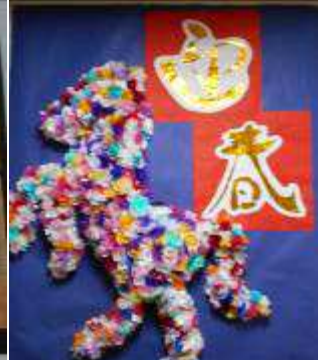
ビニールの花の干支

通所部では、日中の創作活動として馬の花飾りを作りました。新聞紙を丸めて立体的にし、ビニールで作った花を貼り付けました。また、十二枚の花は利用者の方にデザインを選んでもらい、貼り絵や切り絵にし、クレヨンや絵の具で仕上げられています。それぞれ個性が良く出ていて華やかに仕上がりました。通所部玄関に貼ってありますので見に来て下さい。