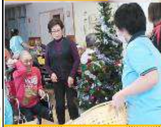
玉入れゲームの様子