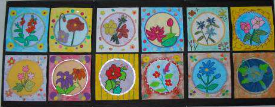
切り絵で作った十二枚の花、作成期間は2か月の力作です。