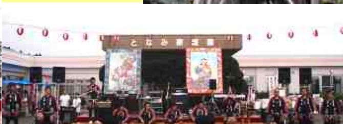
横迎町豪川組 田名部祭り囃子