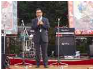
青森県議 菊池健治氏