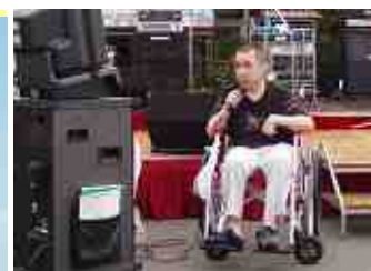
熱唱! 利用者カラオケ