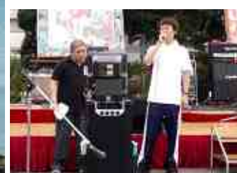
熱唱! 利用者カラオケ