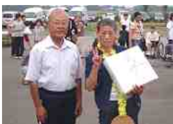
盆踊り 下北小唄賞