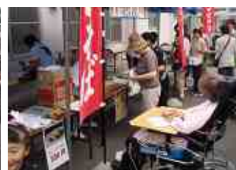
屋台 やきとり&焼きそば