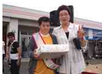
盆踊り おしまご賞