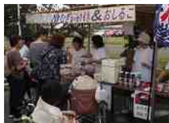
屋台 冷麦&おしるこ