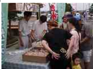
パン直売 工房「歩み」