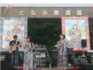
ジェミー・ピークス