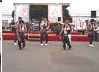
赤十字奉仕団 踊り