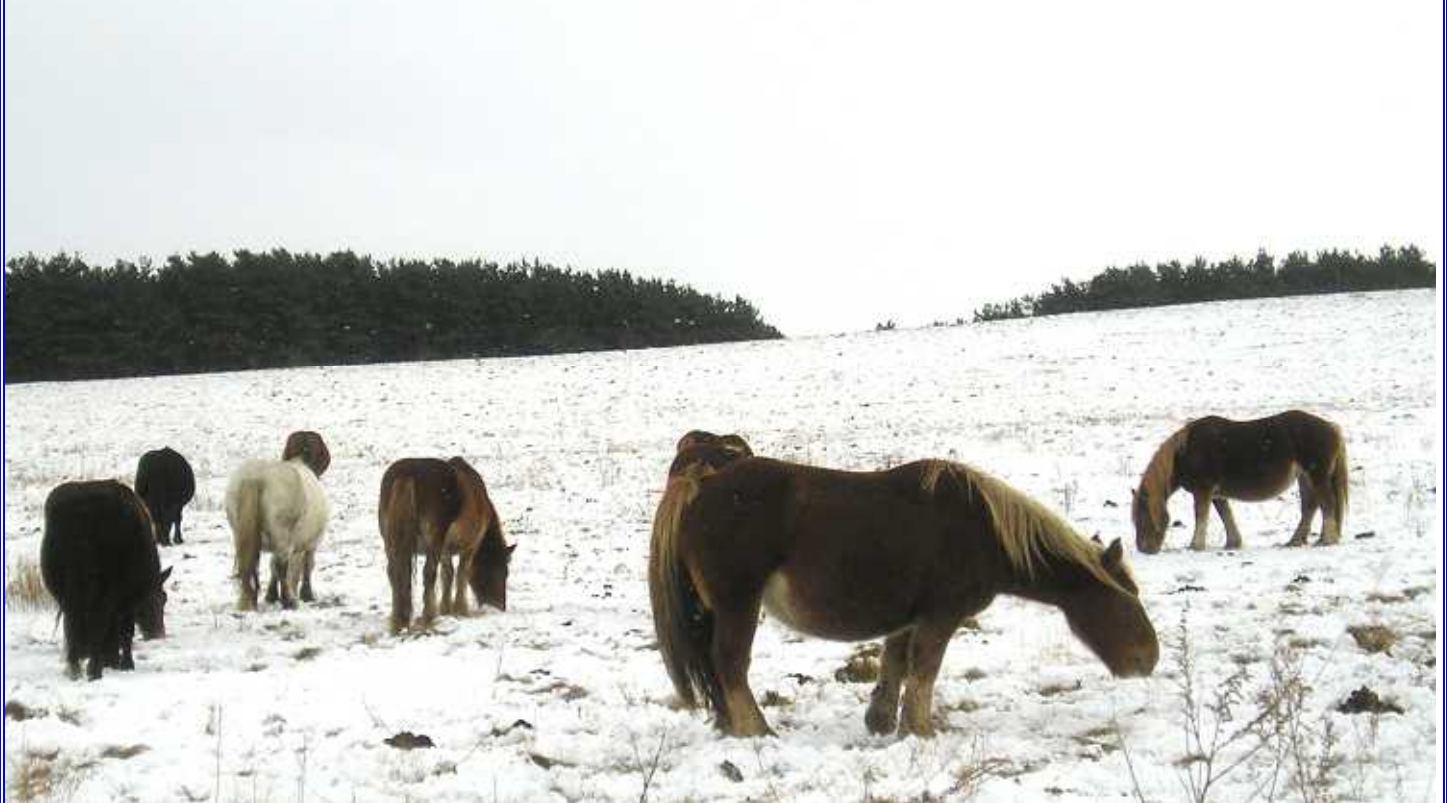
美しいむつ下北の風景「厳冬の雪原で寒風に耐える寒立馬」(東通村尻屋地区越冬放牧地アタカにて撮影)